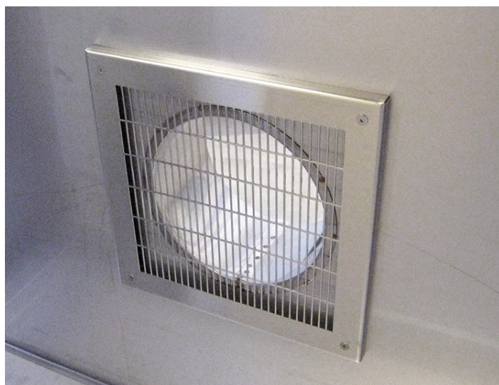
Emhætte model VKE, net tilslutning