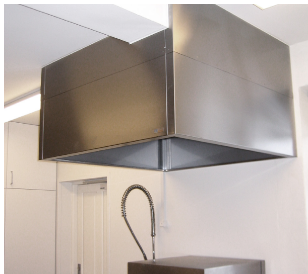
Emhætte model VKE, monteret over industriopvasker