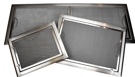
Model A en halv, A og A dobbelt