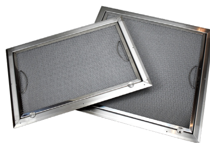
Model A og B